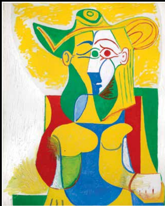
Pablo Picasso, Jacqueline assise avec un chapeau vert et jaune , 1962, h/1,162 x 130 cm, Collection particulière, © Succession Picasso / 2016, ProLitteris, Zurich / Photo Claude Germain